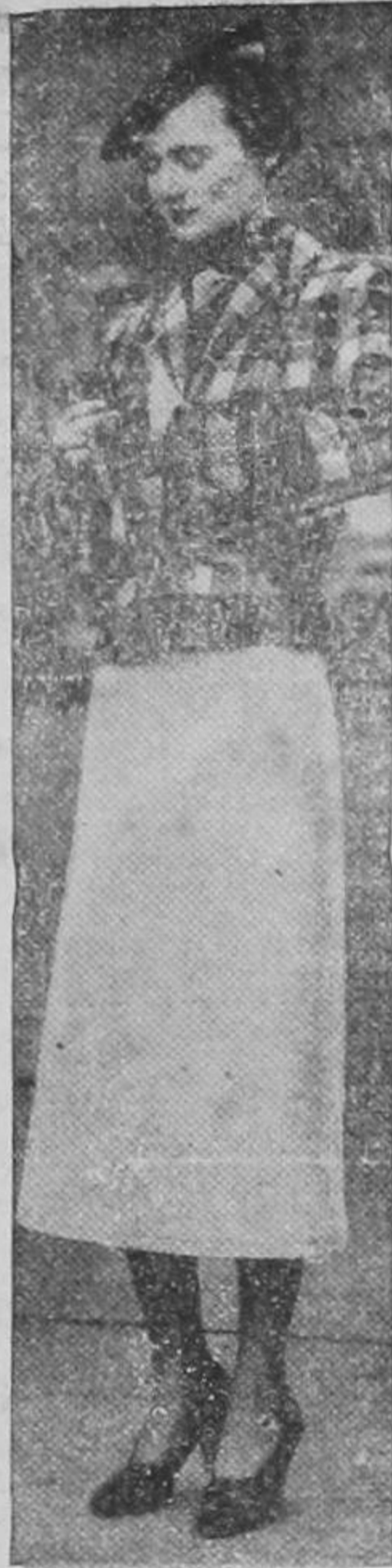
PARIS FASHIONS-№ 3

Mañana serán despedidos por sus numerosas amistades, el gran historiador peruano don