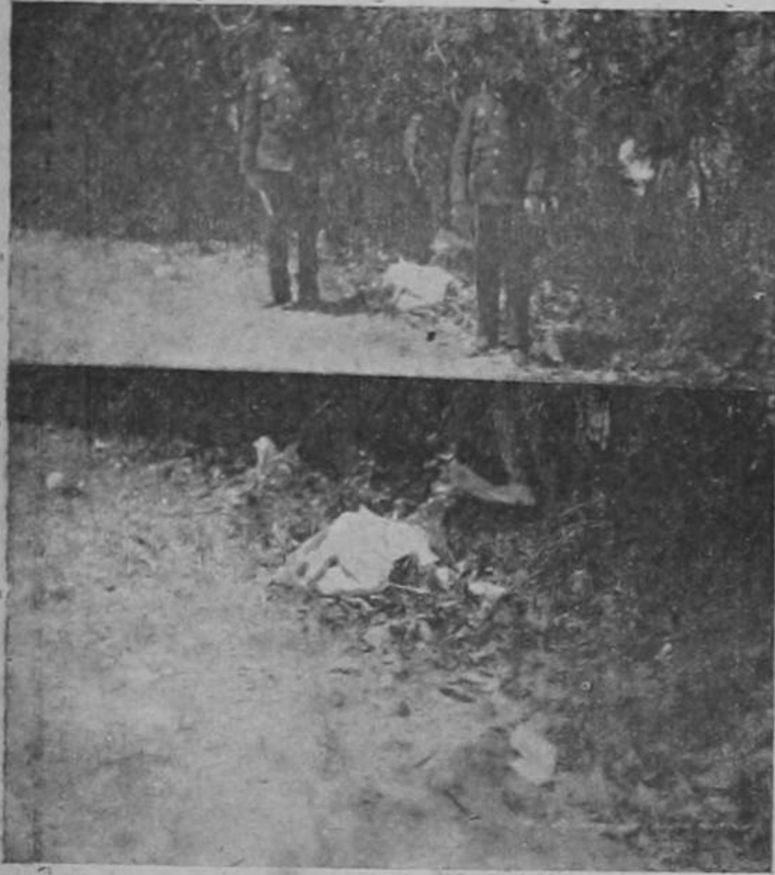
El macabro hallazgo de esta mañana: un feto depositado, según la versión de un niño, por una mujer y según lo que afirma un

chofero, por un hombre que corría desesperadamente. Dos gemelos hacen guarda y vigilancia.