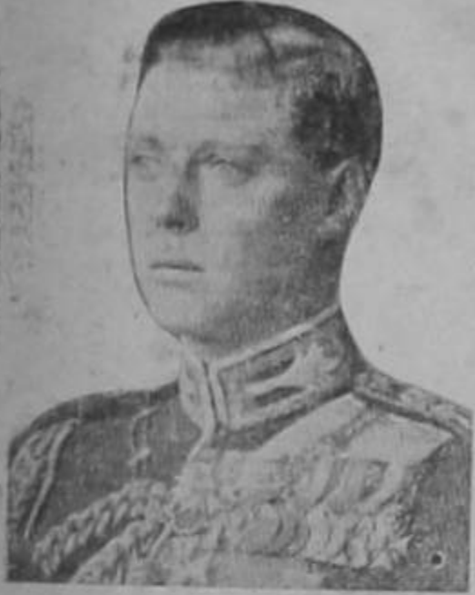
Su Majestad el Rey Eduardo VIII

LONDRES, 2. — En su primer discurso por radio dirigido al imperio británico el Rey Eduardo