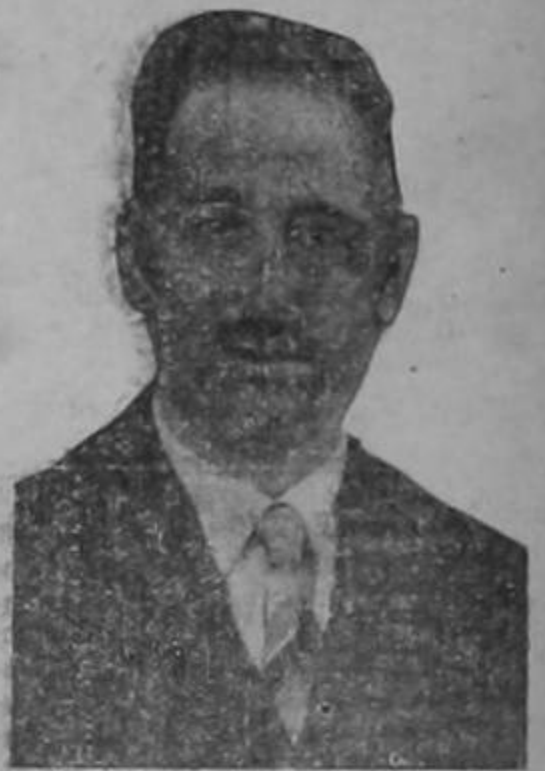
DON LUIS COMPANYS

WASHINGTON, 2. — El presidente Roosevelt inaugurará el miércoles próximo la presa Norris, destinada a formar un lago artificial con las aguas del río Tennessee, como base de un vasto sistema de irrigación.